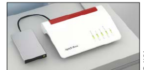
Die Fritzbox als NAS bietet zentralen Speicherplatz im Heimnetz.