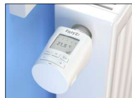
Intelligente Heizungsregler helfen beim cleveren Energiesparen.