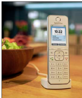
Fritzfons bieten mehr Funktionen als herkömmliche DECT-Telefone.