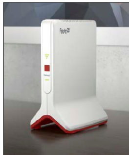
WLAN-Repeater erweitern Heimnetzwerke mit Mesh-Technik.