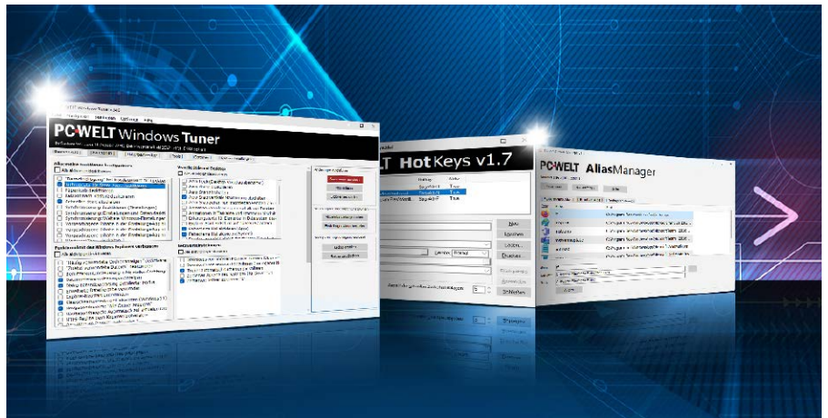
Auf unserer DVD finden Sie zahlreiche selbstentwickelte Tools, die Ihnen den Umgang mit Ihrem Windows-System deutlich erleichtern.

Wenn das WLAN nicht so funktioniert, wie es soll, kann das verschiedene Gründe ha-